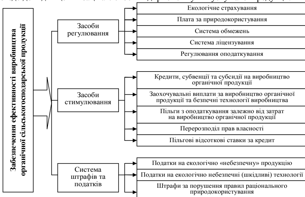
Рис. 1. Економічний механізм підвищення ефективності виробництва органічної сільськогосподарської продукції

Законодавчим шляхом повинні встановитися подальші заходи забезпечення ефективності виробництва органічної продукції (рис. 1). Реалізація запропонованих заходів з виявлення ефективності виробництва органічної продукції, а також безоплатне надання коштів державних і місцевих бюджетів призведе до підвищення зацікавленості підприємств у випуску такої продукції.