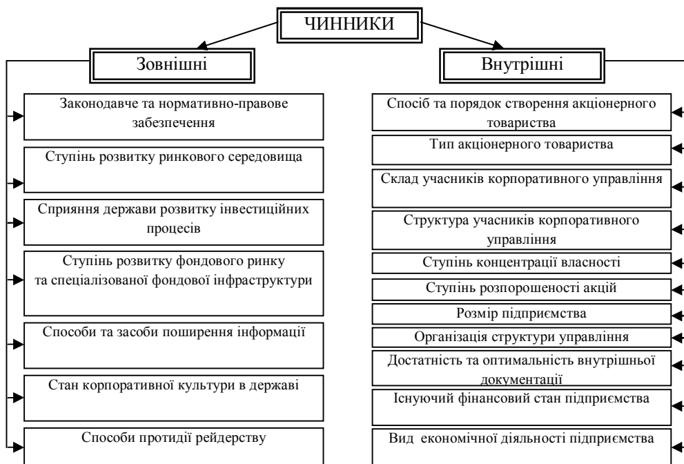
Рис. 3. Чинники, що впливають на формування механізму корпоративного управління в акціонерному товаристві

Отже, під механізмом корпоративного управління розуміємо комплексну організовану структуру відносин між суб'єктами та об'єктами управління, що діє через використання всієї сукупності законів, способів, методів, норм й інструментів щодо узгодження інтересів корпоративних учасників в рамках мети функціонування акціонерного товариства. Формування механізму корпоративного управління повинне ґрунтуватися на використанні принципу цілісності, що припускає взаємозв'язок елементів, які впливають на створення синергетичного ефекту.