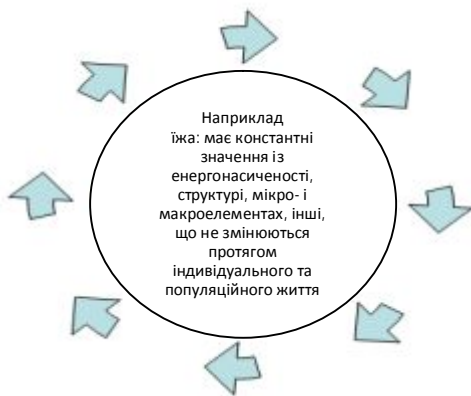
Рис. 1. Потреби вітальні (життєві)

технічними досягненнями суспільства, його культурою, а також моделлю соціального устрою і існуючими цілями розвитку. Вітальні (життєві) потреби людини і їх задоволення можна відобразити у вигляді замкненого «кола», яке демонструє здатність зберігати певну константність в силу наявних природних регуляторних механізмів цих потреб, можливостей їх задоволення (рис. 1). Відображенням же механізму дії соціальних потреб людини, їх зростання та задоволення буде умовна «спіраль», кожний із завитків якої базується на попередньому і слугує, у свою чергу, базою для наступного, більш високого завитка спіралі (рис. 2)