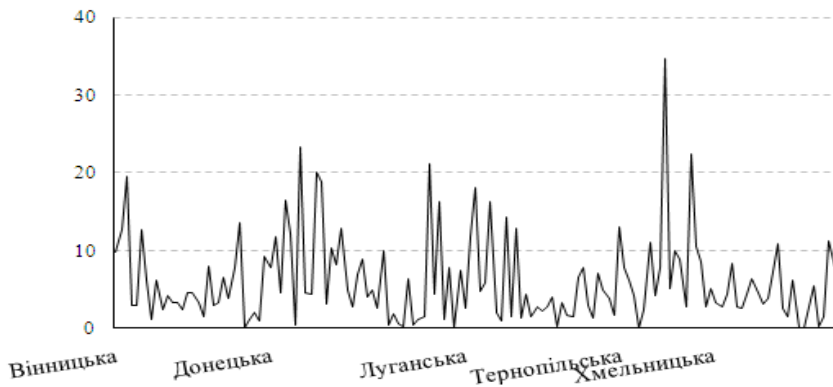
Рис. 1. Прямі оцінки рівня безробіття для сільських районів пілотних областей, 2010 р.