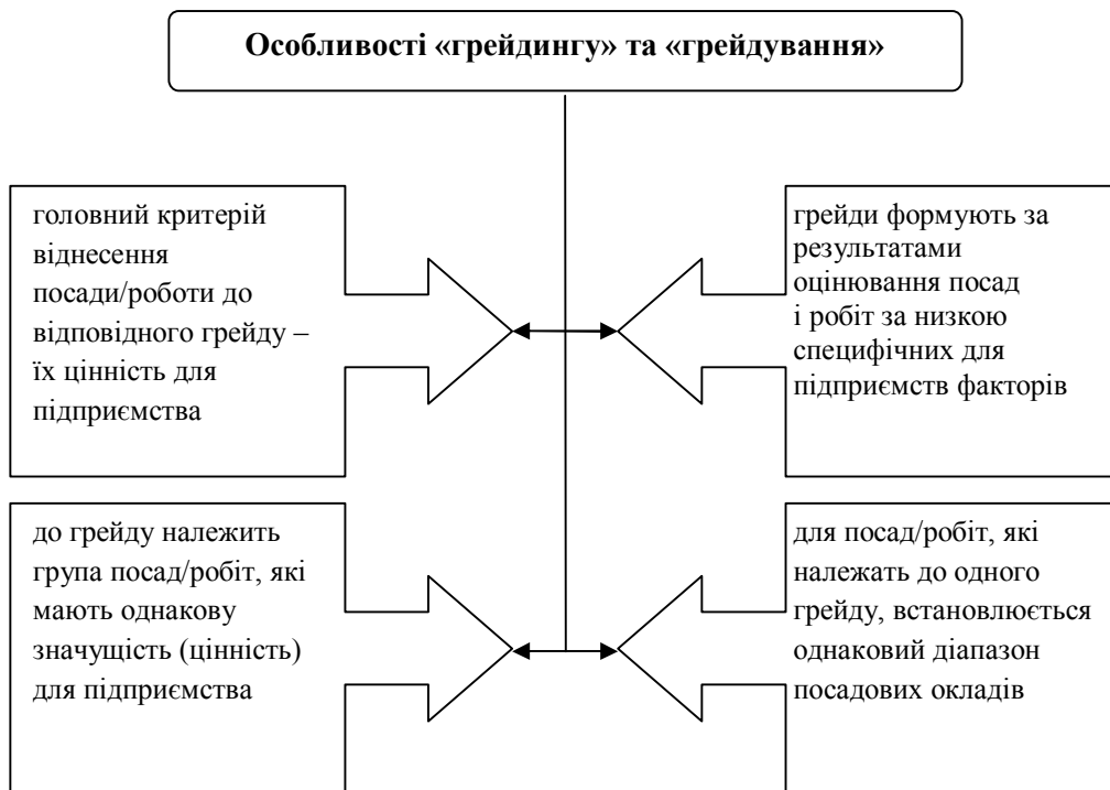
Рис. 1. Характерні особливості понять «грейд» та «грейдування»

Грейдування, власне, є однією з можливих процедур тарифікації робіт. Порівняно зі стандартними тарифікаційними процедурами, грейдування досконаліше, бо дозволяє у повній мірі врахувати індивідуальні потреби підприємства в диверсифікації заробітної плати.