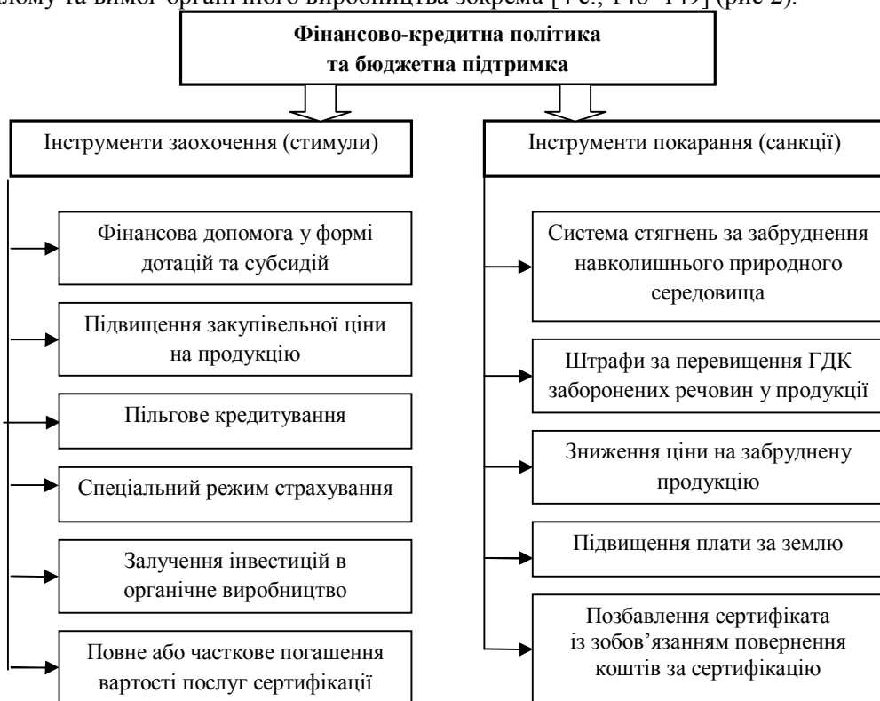
Рис. 2. Інструменти фінансово-кредитної та бюджетної політики на ринку органічної продукції

Фінансово-кредитна політика та бюджетна підтримка. За допомогою фінансово-кредитних інструментів держава заохочує виробників до ведення органічного виробництва та застосовує санкції до порушників екологічних норм в цілому та вимог органічного виробництва зокрема [4 с., 148–149] (рис 2).