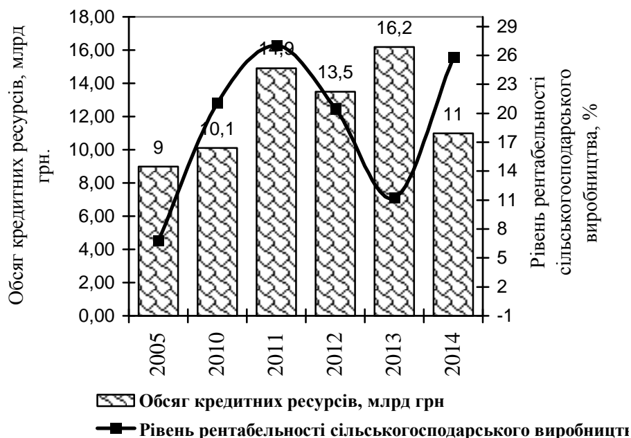
Рис. 3. Вплив обсягу залучених кредитних ресурсів на рівень рентабельності виробництва в сільськогосподарських підприємствах

Проведений аналіз впливу обсягу залучених кредитних ресурсів на рівень рентабельності виробництва у сільськогосподарських підприємствах за 2005–2014 рр. засвідчує, що для здійснення виробничих програм в аграрному секторі залучили кредитів на суму 11 млрд грн, що на 2 млрд грн більше, ніж у 2005 р. (рис. 3).