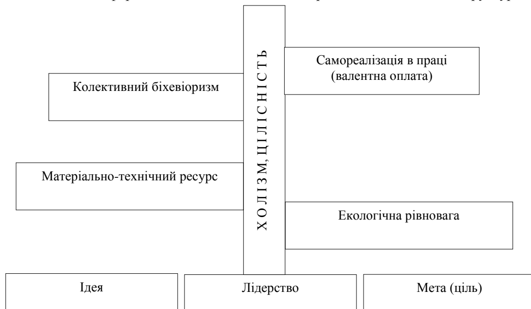
Рис. 2. Дерево гешталту кооперативно-екологічної структури

На первинному рівні, на основі наших узагальнень та аналітичного дослідження, сформований генштальт кооперативно-екологічної структури