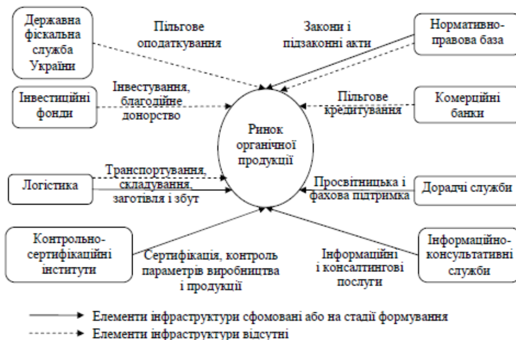
Рис. 3. Інфраструктура ринку органічної продукції