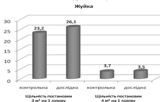
Рис 2. Тривалість процесу жуйки в дослідних групах тварин

Встановлено, що у споживанні кормів та процесі жуйки переважали тварини з меншою щільністю постановки на 1 м 2 площі на 8,8% та 11,1% відповідно (рис 1 і 2).