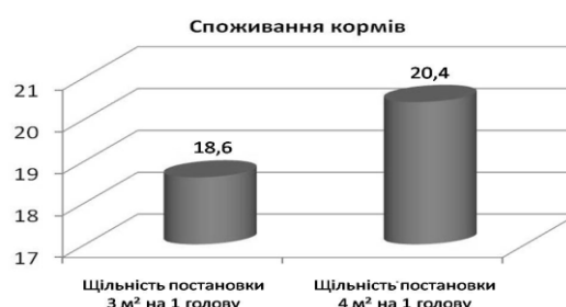
Рис 1. Споживання кормів дослідними тваринами

Аналіз етологічних спостережень молодняку у різному віці показав, що кормова реакція тварин по жуйці та споживанню кормів була довшою у другій дослідній групі. Телиці переважали ровесниць I групи, зокрема, у 8 міс. віці на 15,3%; 12 міс. – 13%; 16 міс. – 5,4% (рис 1, 2).