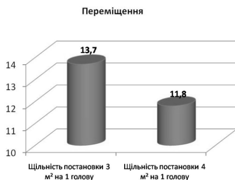
Рис 4. Переміщення

Згідно з результатами досліджень, біохімічні показники крові телиць волинської м'ясної породи, за різної щільності постановки в тваринницькому приміщенні, були в межах фізіологічних коливань (табл. 3). Слід відзначити, що у тварин, які утримувалися при меншій скупченості (II група), вміст гемоглобіну був вищий на 9,8 % ( p < 0,001 ) та каротину – на 34,4 % ( p < 0,01 ), порівняно з телицями, які утримувалися при більшій скупченості (I група). За різної щільності постановки в приміщенні у ремонтних телиць суттєвих відмінностей щодо