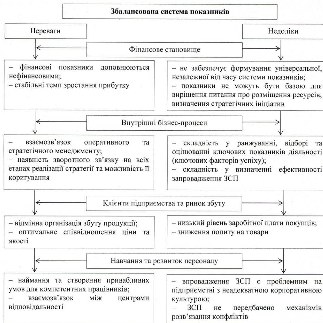
Рис. 2. Переваги та недоліки застосування ЗСП у стратегічному обліку підприємств

діяльності [3, с. 10]. Система збалансованих показників пропонує новий підхід – оцінку всіх напрямів діяльності підприємства шляхом індивідуального підбору показників для окремого підприємства (галузі) з метою не тільки оцінити досягнутий рівень розвитку підприємства, а й проаналізувати подальший розвиток підприємства за всіма напрямками діяльності [10, с. 20].