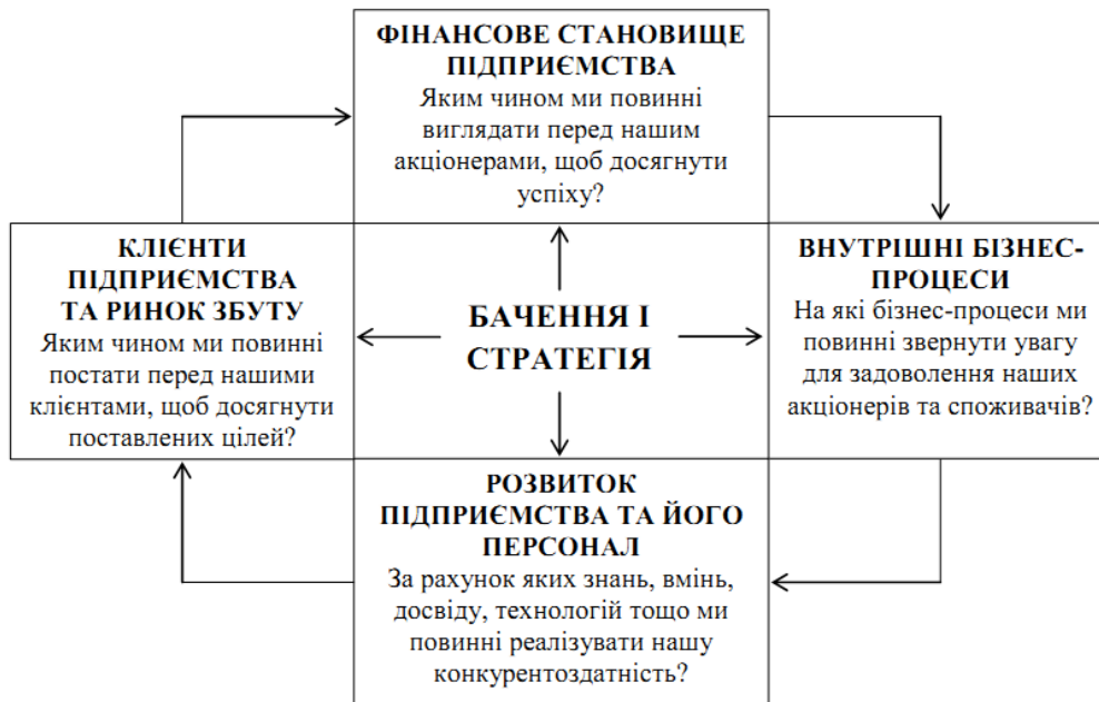
Рис. 1. Декомпозиція стратегії підприємства з позиції системи збалансованих показників

При складанні збалансованої системи показників стратегія розкладається по чотирьох перспективах (класичний підхід): фінансове становище підприємства; клієнти підприємства та ринок збуту; внутрішні бізнес-процеси; розвиток підприємства та його персонал (рис. 1).