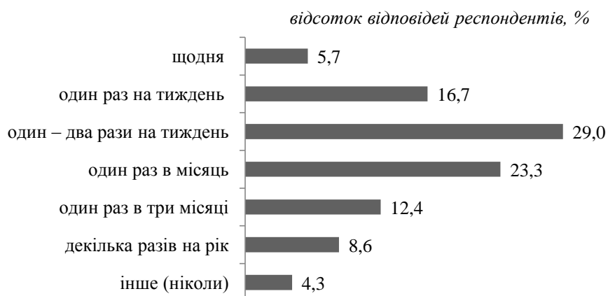
Рис. 2. Розподіл відповідей сільських жителів радіоактивно забруднених територій щодо частоти споживання риби із місцевих водойм