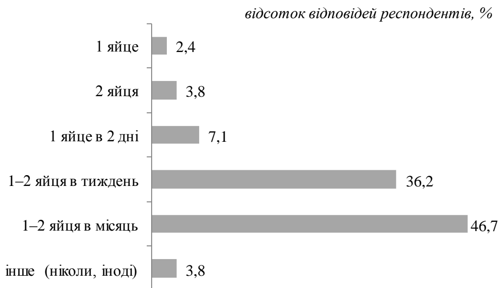
Рис. 3. Розподіл відповідей сільських жителів радіоактивно забруднених територій щодо частоти споживання яєць власного виробництва

За проведеними дослідженнями сільський мешканець радіоактивно забрудненої території протягом року споживає близько 86 яєць власного виробництва. Розподіл респондентів щодо обсягів споживання яєць наведено на рис. 3.