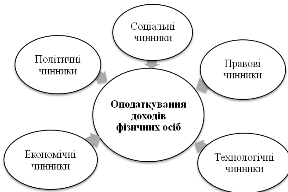
Рис. 2. Чинники зовнішнього впливу на оподаткування доходів фізичних осіб

випадків автори виділяють зовнішні та внутрішні фактори впливу на діяльність будь-якої системи. Важливість зовнішніх факторів також залежить від ступеня їх впливу на оподаткування доходів фізичних осіб, тому доцільним буде сформулювати перелік основних факторів зовнішнього середовища (непрямої дії) для подальшого визначення значущості їх впливу на оподаткування (рис. 2.).