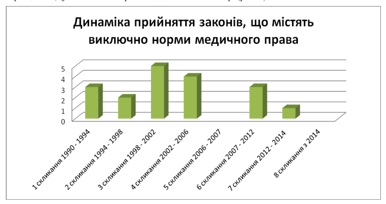
Рис. 1. Динаміка прийняття законів, що містять виключно норми медичного права

З наведеної діаграми можна зробити певні висновки. Найбільш «урожайним» для власне медичного законодавства було третє скликання: прийнято п'ять законів. Найменш продуктивним виявилося п'яте скликання: не прийнято жодного закону, проте його термін був незначним – лише один рік. Також прикрим є те, що за поточне скликання досі не ухвалено жодного закону з медичного права.