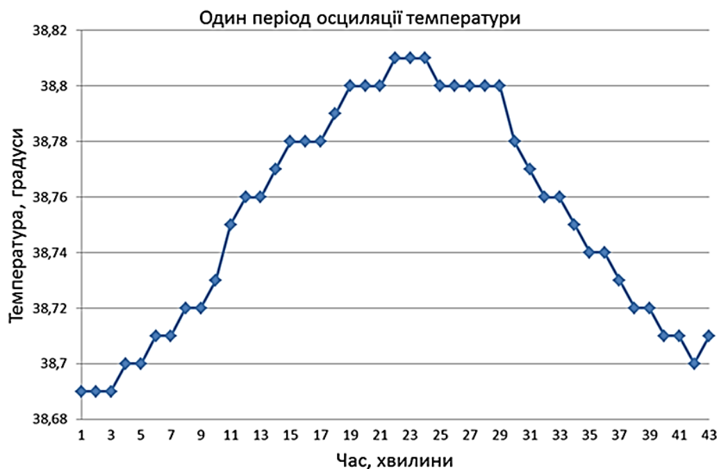
Рис. 1. Графік зміни температури середовища культивування ОКК з 40-хвилинним періодом її осциляції в термоосциляторі.