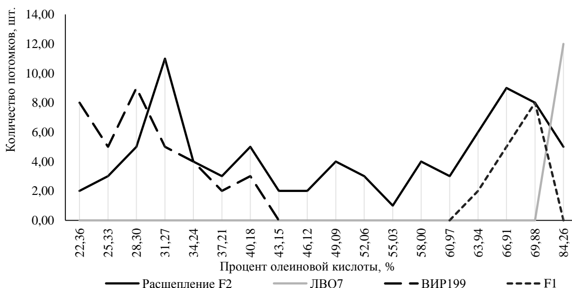
Рис. 2. Содержание олеиновой кислоты в родительских линиях и потомствах от скрещивания ЛВО7 x ВИР199

В таблице 3 также представлены данные по расщеплению во втором поколении комбинации ВИР199 x ЛВО7. Поскольку было получено и проанализировано большое количество растений по составу масла, мы обработали также эти данные согласно методике генетических исследований полигенных признаков и получили распределения, представленные на рис 2.