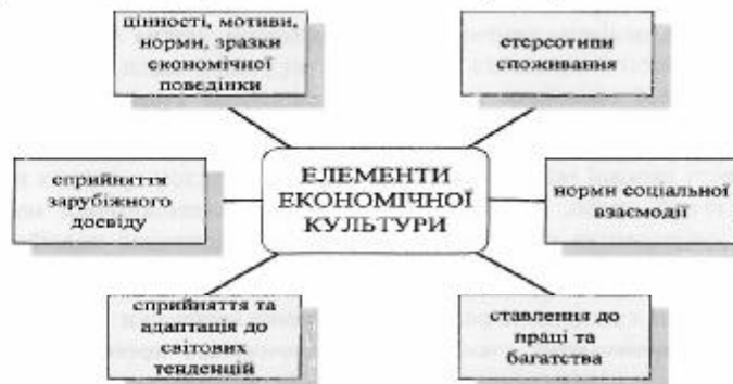
Рис. 2. Елементи економічної культури

Економічну культуру можна досліджувати в таких аспектах (рис. 2).