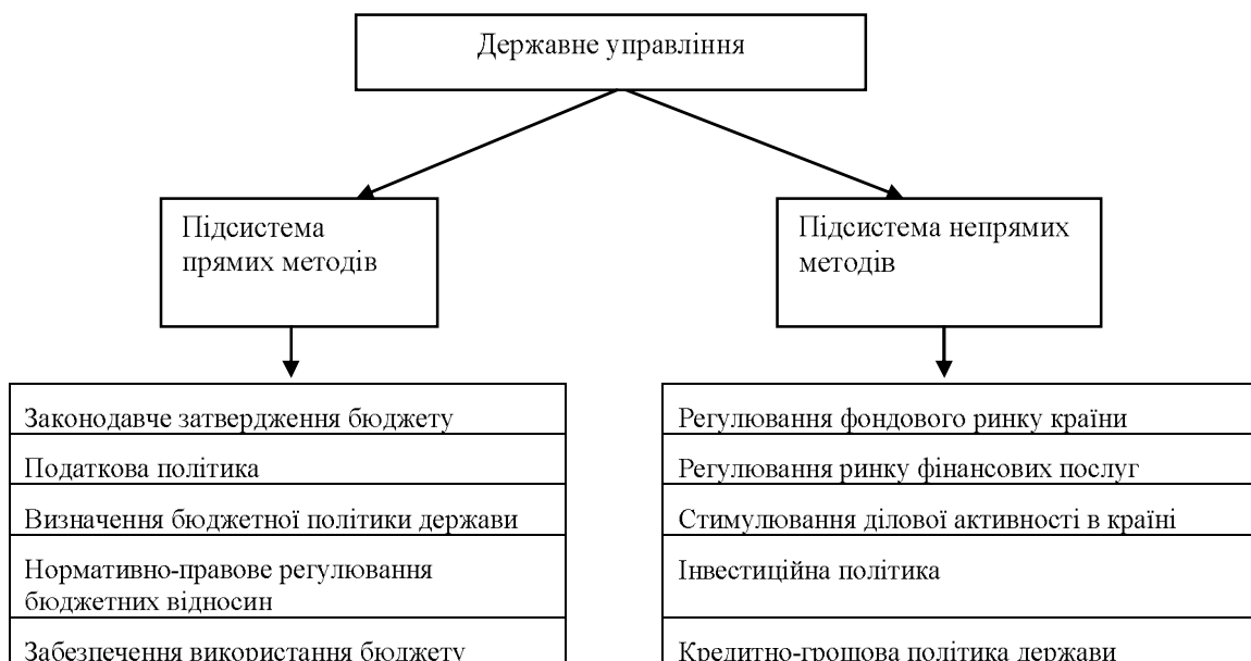
Рис. 2. Класифікація методів державного управління бюджетом

На основі аналізу засобів та форм державного управління бюджетом узагальнена система методів управління бюджетом, що використовуються в країні. Їх класифікація представлена на рис. 2.