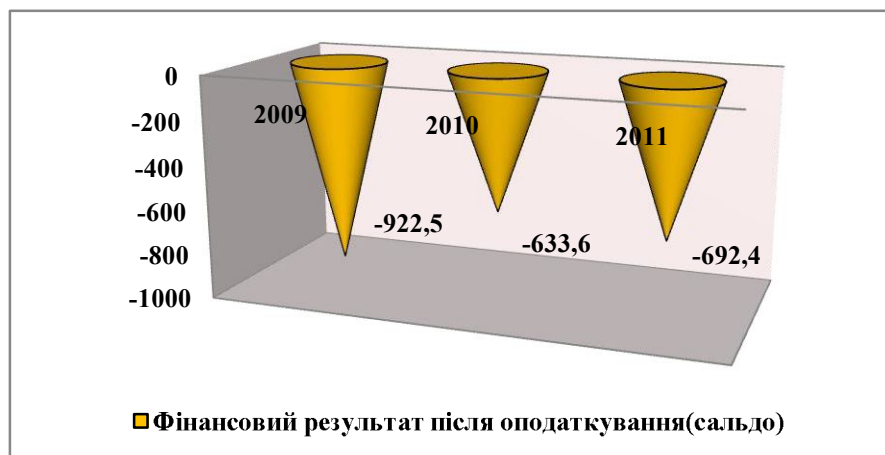
Рис. 4. Динаміка обсягів фінансових результатів після оподаткування підприємств готельно-ресторанного бізнесу у 2009-2011рр.

При цьому слід відзначити, що у 2011 році спостерігалася негативна тенденція випередження темпів росту операційних витрат (10,1%) над темпами росту обсягів реалізованих послуг готелями та ресторанами (9,9%), (див. табл. 8). Ця тенденція відповідно створила передумови для формування від'ємних фінансових результатів за підсумками діяльності підприємств готельного та ресторанного бізнесу. Як свідчить рисунок 4, протягом всього аналітичного періоду підприємства сфери готельно-ресторанного бізнесу зазнавали збитків.