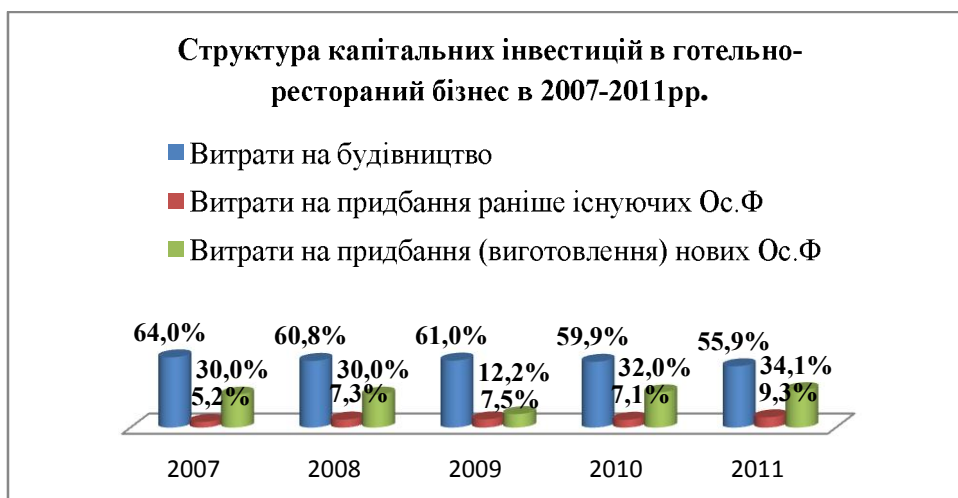
Рис. 2. Структура капітальних інвестицій на підприємствах готельно-ресторанного бізнесу, складено автором за матеріалами Статистичного щорічника 2011р. [3]

У структурі капітальних інвестицій протягом цього періоду переважали витрати на будівництво (у середньому 60%) та витрати на придбання (виготовлення) нових основних фондів (у середньому 30%). Це свідчить про достатньо прогресивну структуру капітальних вкладень у сфері готельно-ресторанного бізнесу. Але останнім часом спостерігаються повільні структурні зрушення в складі капітальних вкладень у напрямку зменшення частки витрат на будівництво (з 64% до 55,9%) та одночасного зростання частки витрат на придбання основних фондів (з 30% до 34%), див. рис. 2. Це пояснюється тим, що з підготовкою до Євро-2012 ресторанно-готельний бізнес почав стрімко реконструюватись. Готелі та ресторани Одеси, Дніпропетровська, Києва, Львова, Донецька та інших міст посилено готувались до чемпіонату та прийому туристів.