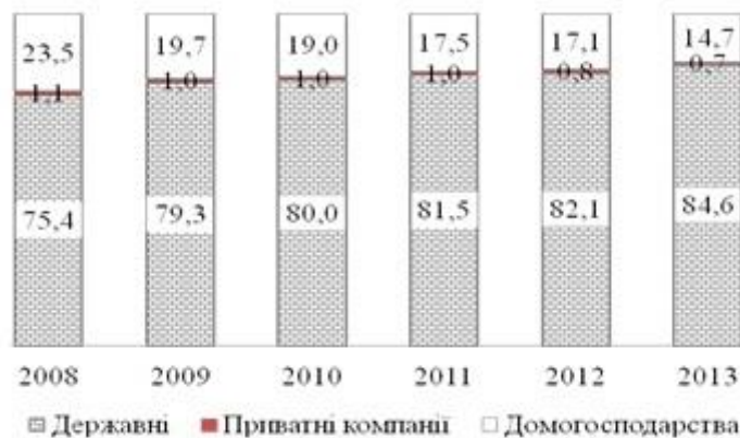
Рис. 1. Структура видатків на освіту в Україні за джерелами фінансування у 2008-2013 рр.

Основу фінансування видатків на освіту складають державні кошти, адже їх частка в сукупних витратах на освіту зросла з 75,4% на початок 2008 р. до 84,6% на початок 2013 р. Наступним вагомим джерелом забезпечення витрат на освіту виступають кошти домогосподарств, хоча їх питома вага скоротилась у сукупних витратах на освіту з 23,5% у 2008 р. до 14,7% у 2013 р. за рахунок зростання бюджетного фінансування. Найменша частка фінансування витрат на освіту припадає на приватні компанії – 1,1% у 2008 р. та ще менше у 2013 р. – 0,7% (рис. 1).