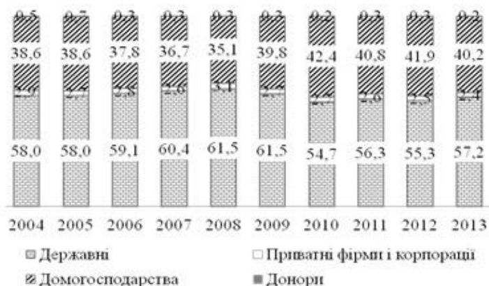
Рис. 3. Структура видатків на охорону здоров'я в Україні за джерелами фінансування у 2004-2013 рр. Джерело: розраховано та побудовано автором на основі даних [7, с. 8; 11, с. 8]

Роль охорони здоров'я в Україні є близькою до середньосвітових значень, про що свідчать дані про частку сукупних видатків на охорону здоров'я у ВВП в Україні та в середньому в країнах світу (рис. 4).