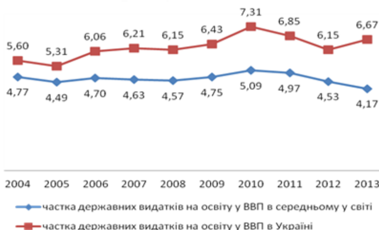
Рис. 2. Динаміка частки державних видатків на освіту у ВВП в Україні та в середньому у світі у 2004-2013 рр. Джерело: розраховано та побудовано автором на основі даних [7, 8]

Як видно з рис. 2, частка державних видатків на освіту у ВВП в Україні протягом останнього десятиріччя зросла з 5,6% у 2004 р. до 6,67% у 2013 р., а за даними ЮНЕСКО із 228 досліджуваних країн світу середня частка державних видатків на освіту у ВВП зменшилася з 4,77% у 2004 р. до 4,17% у 2013 р.