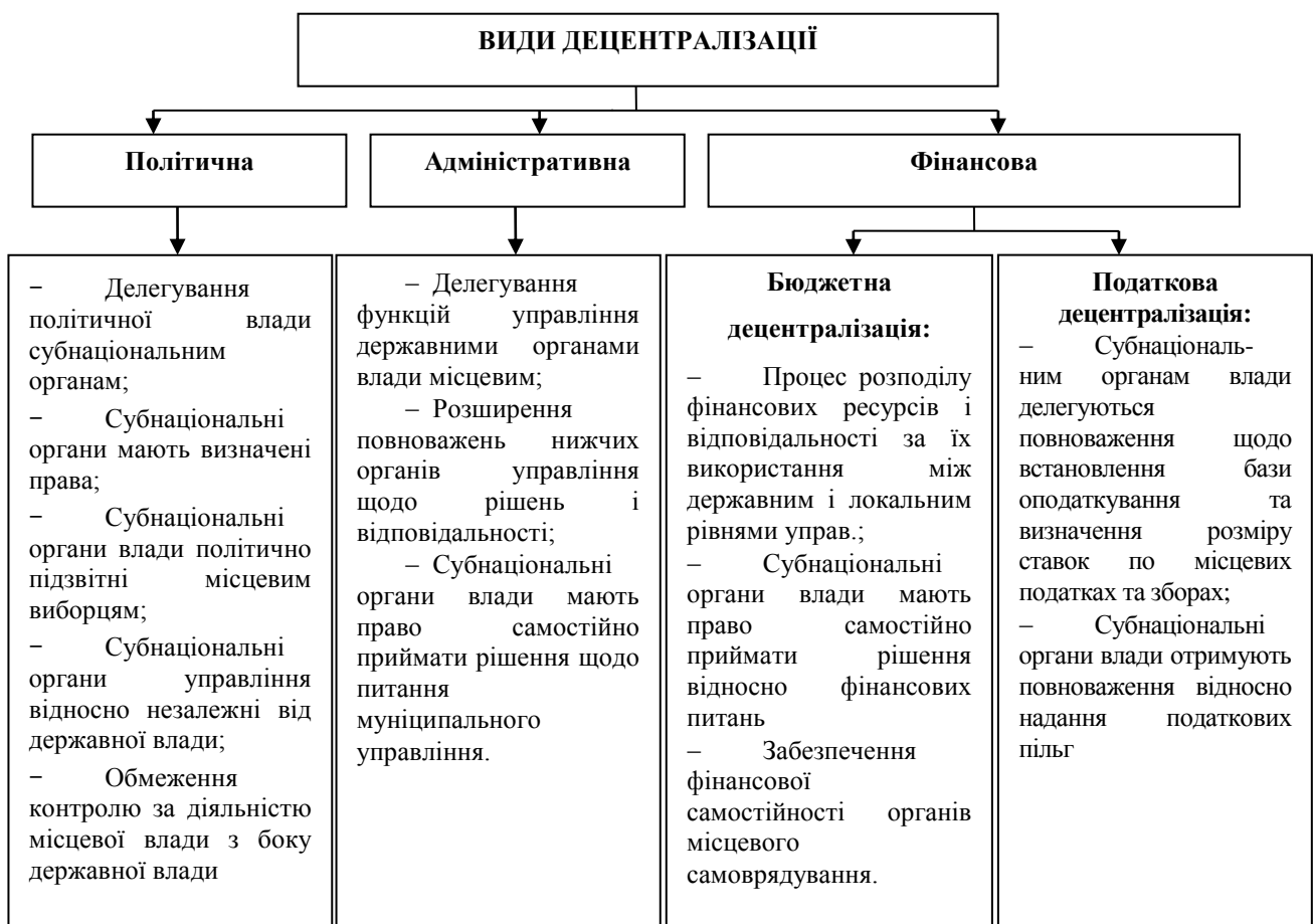
Рис. 1. Види децентралізації державного управління Деталізовано авторами на основі [1]

Існує декілька видів децентралізації, які мають різні характерні ознаки, наслідки та умови реалізації, а саме політична, адміністративна, фінансова, які можуть впроваджуватись як самостійно, так і у взаємозв'язку одна з одною, в різних формах і різноманітних сполученнях як в межах країни, так і в окремих галузях народного господарства (рис. 1).