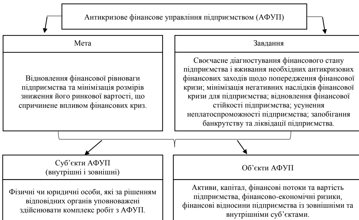
Рис. 3. Зміст основних елементів антикризового фінансового управління на підприємстві [6]

Реалізація завдань антикризового фінансового управління на підприємстві відбувається шляхом виконання ним сукупності функцій. Аналіз та узагальнення літературних джерел з проблематики антикризового управління підприємством дозволяє стверджувати, що функції АФУП доцільно розділити на три основні підгрупи, а саме: базові, специфічні та інтеграційні (об'єднувальні), що об'єднують базові та специфічні функції АФУП у єдиний процес, забезпечуючи його неперервність та ефективність: