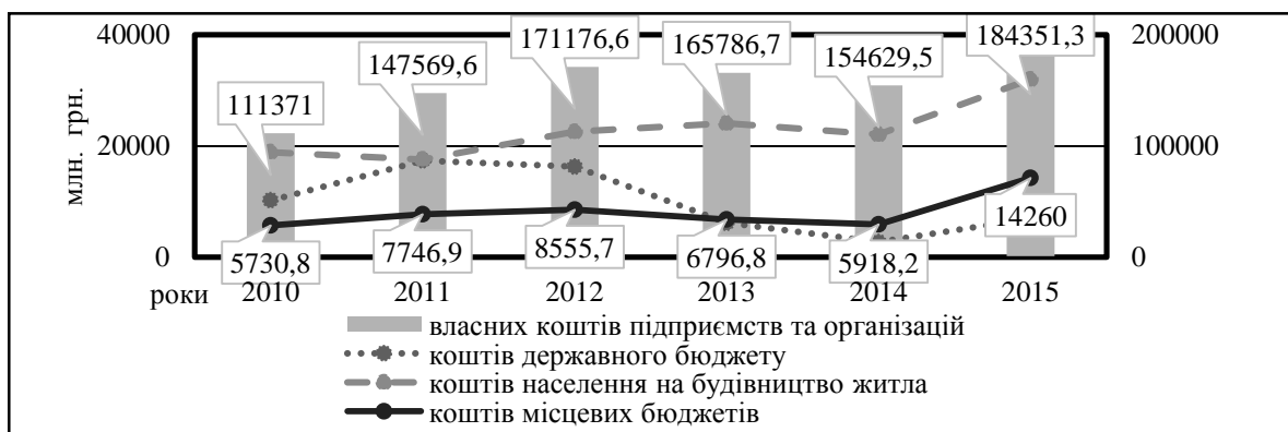
Рис. 2. Динаміка капітальних інвестицій за джерелами фінансування в промисловість України за 2010–2015 рр., млн грн. [12]

Як видно з рис. 2, основним джерелом фінансування капітальних інвестицій є власні кошти підприємств та організацій, оскільки вони мають позитивну динаміку, починаючи з 2011 р. і відповідно їх обсяг у 2015 р. становив 184351 млн грн., що на 29721 млн грн. та 19% перевищує обсяг 2014 р. та на 18564 млн грн. і 11% більше за обсяг 2013 р.