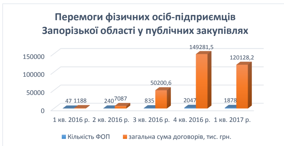
Рис. 3. Перемоги фізичних осіб-переможців Запорізької області в публічних закупівлях протягом 2016 року – 1 кв. 2017 року (розроблено автором за даними системи ProZorro) [4]