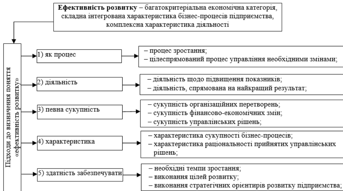
Рис. 1. Підходи до трактування поняття «ефективність розвитку» промислового підприємства

З рис. 1 випливає така теза: на основі узагальнення сутності поняття «ефективність розвитку» слід виділяти п'ять основних підходів при дослідженні даної комплексної економічної категорії.