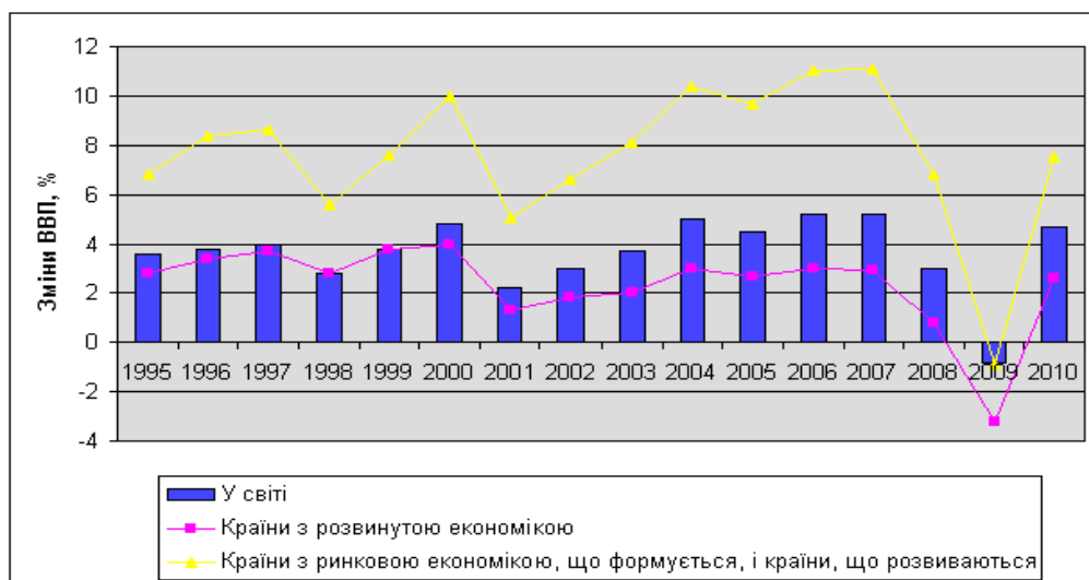
Рис. 1. Спад і підйом світової економіки, 1995-2010 рр. (річні зміни ВВП у постійних цінах, %) [6]

Згідно із сучасними рейтингами міжнародних економічних організацій [1-7], Україна за рівнем конкурентоздатності посідає одне з останніх місць. Напряму уряду на лібералізацію зовнішніх відносин не привів до реалізації конкурентної переваги України. Перевагу лібералізації зовнішньоекономічних відносин треба досліджувати на перших етапах відкриття кордонів, оскільки далеко не однакові умови та розбіжності обумовлювали суттєву різницю між економічними системами України та високорозвинених країн. Показники розвитку української економіки порівняно з найбільшими торговельними партнерами свідчать про недоречність беззастережного відкриття кордонів. За даними Світового банку, ВВП на душу населення в Україні є одним з найнижчих у світі. Виробничо-промисловий комплекс України не здатний адаптуватися до попиту на світовому ринку, про що говорить досить низький ВВП на душу населення [1-7].