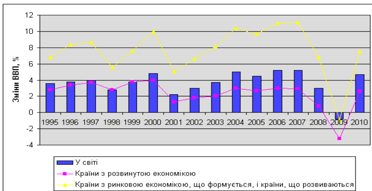
Рис. 1. Спад і підйом світової економіки, 1995-2010 рр. (річні зміни ВВП у постійних цінах, %) [6]

Згідно із сучасними рейтингами міжнародних економічних організацій [1-7] Україна за рівнем конкурентоздатності посідає одне з останніх місць. Напряму уряду на лібералізацію зовнішніх відношень не привів до реалізації конкурентної переваги України. Перевагу лібералізації зовнішньоекономічних відношень треба досліджувати на перших етапах відкриття кордонів, оскільки далеко не однакові умови та розбіжності зумовлювали суттєву відмінність економічних систем України від високорозвинених країн. Показники розвитку української економіки порівняно із найбільшими торговельними партнерами свідчать про недоречність беззастережного відкриття кордонів. За даними Світового банку, ВВП на душу населення в Україні є одним з найнижчих у світі. Виробничо-промисловий комплекс України не здатний адаптуватися до попиту на світовому ринку, про що говорить досить низький ВВП на душу населення [1-7].