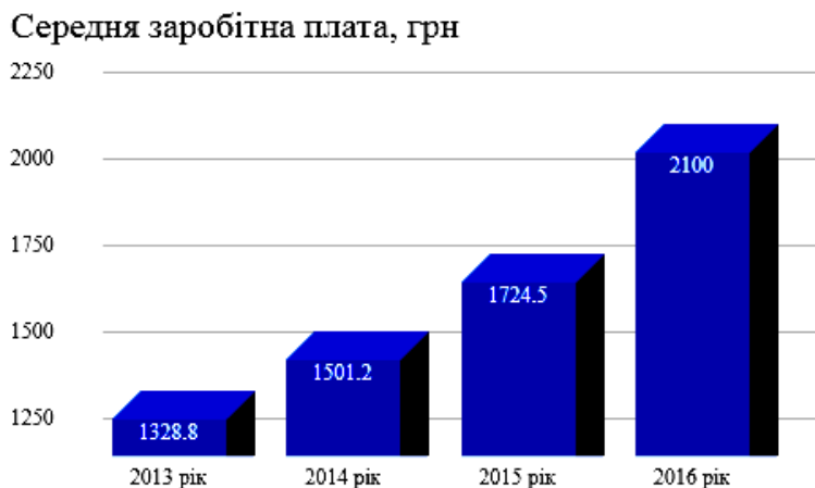
Рис. 3. Середня заробітна плата в Широківській ОТГ [8]

Середня заробітна плата по Широківській ОТГ має сталу тенденцію росту, особливо після утворення громади (рис. 3). Пропорційний поділ середньої заробітної плати до й після утворення Широківській ОТГ показаний на рис. 4.