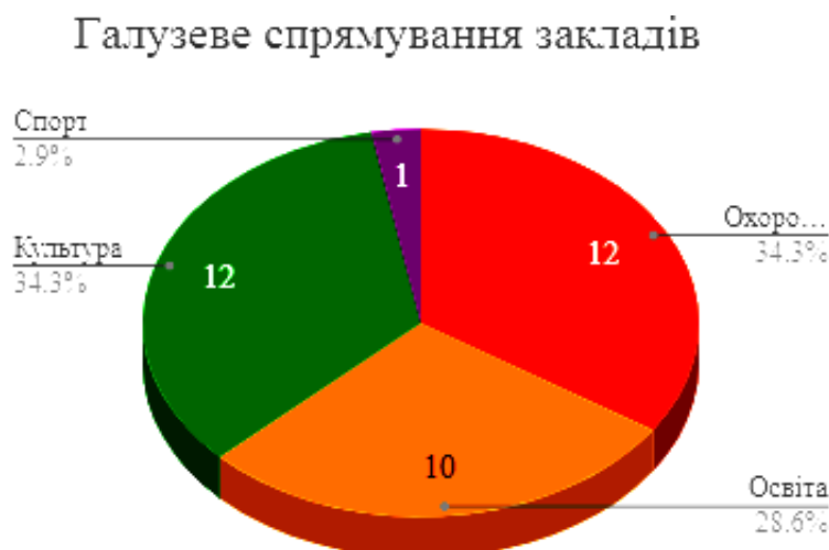
Рис. 1. Галузеве спрямування охорони здоров'я, освіти, культури і спорту у Широківській ОТГ [8]

До складу Широківської сільської об'єднаної територіальної громади, далі – громади, входять 28 населених пунктів. Адміністративний центр громади знаходиться в селі Широке, яке розташоване на відстані 8 км від м. Запоріжжя. Територія Широківської громади складає 36,1 тис. га, майже 40 км узбережжя р. Дніпро. Населення громади – 12,5 тис. осіб. Галузеве спрямування закладів Широківської ОТГ розподілено на 4 сектори (рис.1): охорона здоров'я – 34,3 % (12 осіб); культура – 34,3 % (12 осіб); освіта – 28,6 % (10 осіб); спорт – 2,9 % (1 особа).