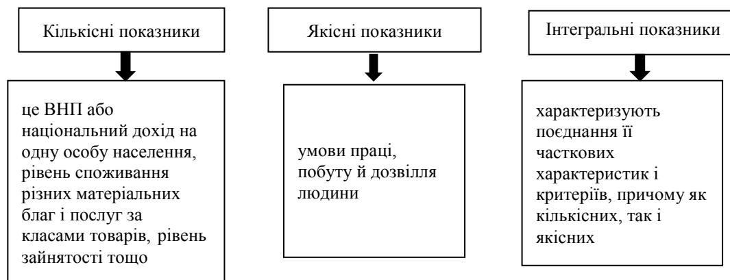
Рис. 1. Загальна характеристика показників, що оцінюють якість життя

Концепція якості життя включає всі аспекти взаємодії людини й навколишнього середовища. Для оцінки якості життя використовуються кількісні, якісні й інтегральні показники (рис.1):