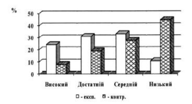
Рис. 4. Рівні підготовленості майбутніх аграріїв з фізкультурно-оздоровчої діяльності за діяльнісним напрямом

При цьому високий рівень готовності студентів до впровадження засобів фізичної культури і спорту під час роботи на виробництві виявився у 24,3 % студентів експериментальних груп і лише у 8,0 % студентів контрольних груп. Щодо достатнього рівня знань та вмінь також мають перевагу студенти експериментальних груп — 31,2 % та 19,1 % — у контрольних групах. Середній рівень становив в експериментальній групі 33,5 %, а в контрольній 27,8 %. Низький рівень в експериментальній і контрольній групах становив відповідно 11,0 % і 45,1 %, що вказує на високу ефективність нової методичної системи фізичного виховання студентів-аграріїв (рис. 4).