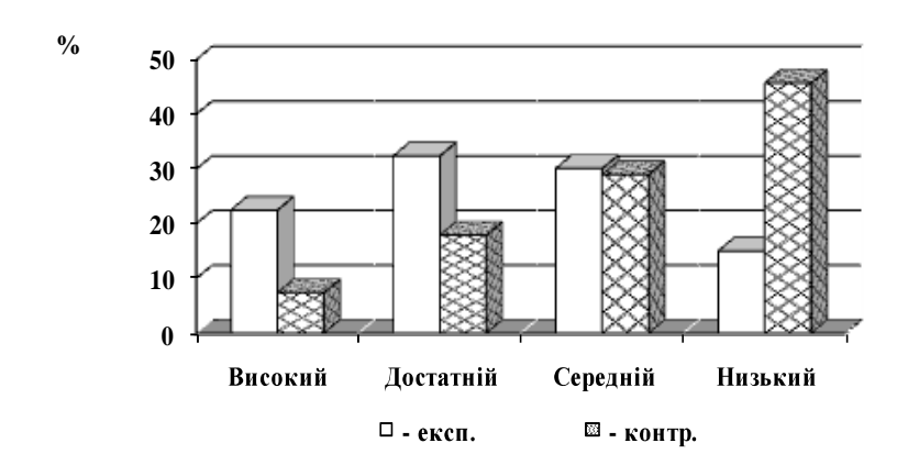
Рис. 2. Рівень мотиваційного компонента майбутніх аграріїв з фізкультурно-оздоровчої діяльності після завершення педагогічного експерименту

Педагогічний експеримент підтвердив суттєве зростання показників мотиваційного компонента в експериментальних группах. Так, високий рівень сформованості в експериментальних групах становив 22,5 %, достатній — 32,4 %, середній — 30,1 % і низький лише 15,0 %. Що стосується контрольних груп, то високий рівень сформованості спостерігається у 7,4 % досліджуваних, достатній — у 17,9 %, середній у — 29,0 %, а низький становив 45,7 % тих, хто брали участь в експерименті (рис. 2).