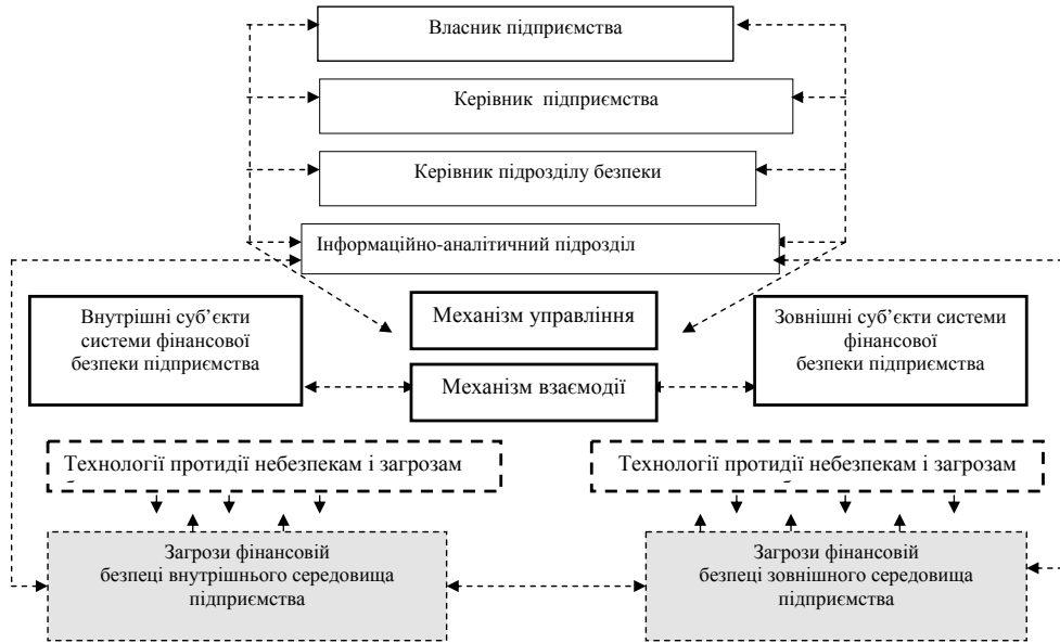
Рис. 2. Модель функціонування системи фінансової безпеки підприємств птахівництва