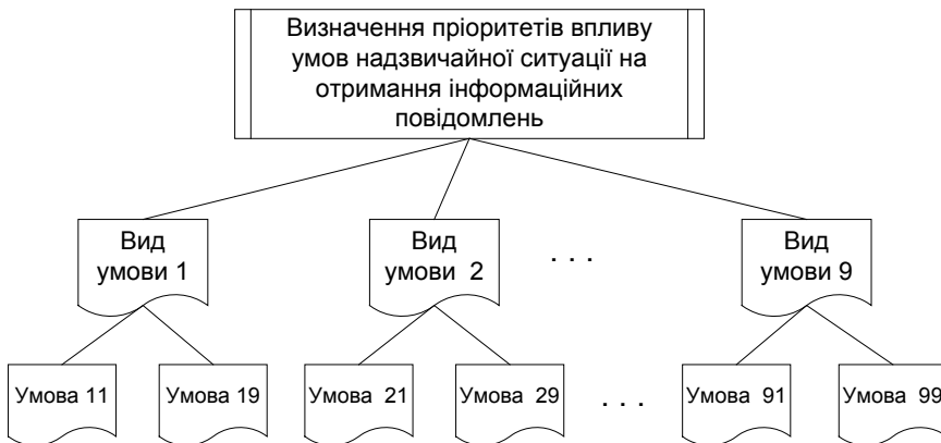
Рис. 2. Узагальнений вигляд ієрархії для визначення пріоритетів впливу умов надзвичайної ситуації на отримання інформаційних повідомлень