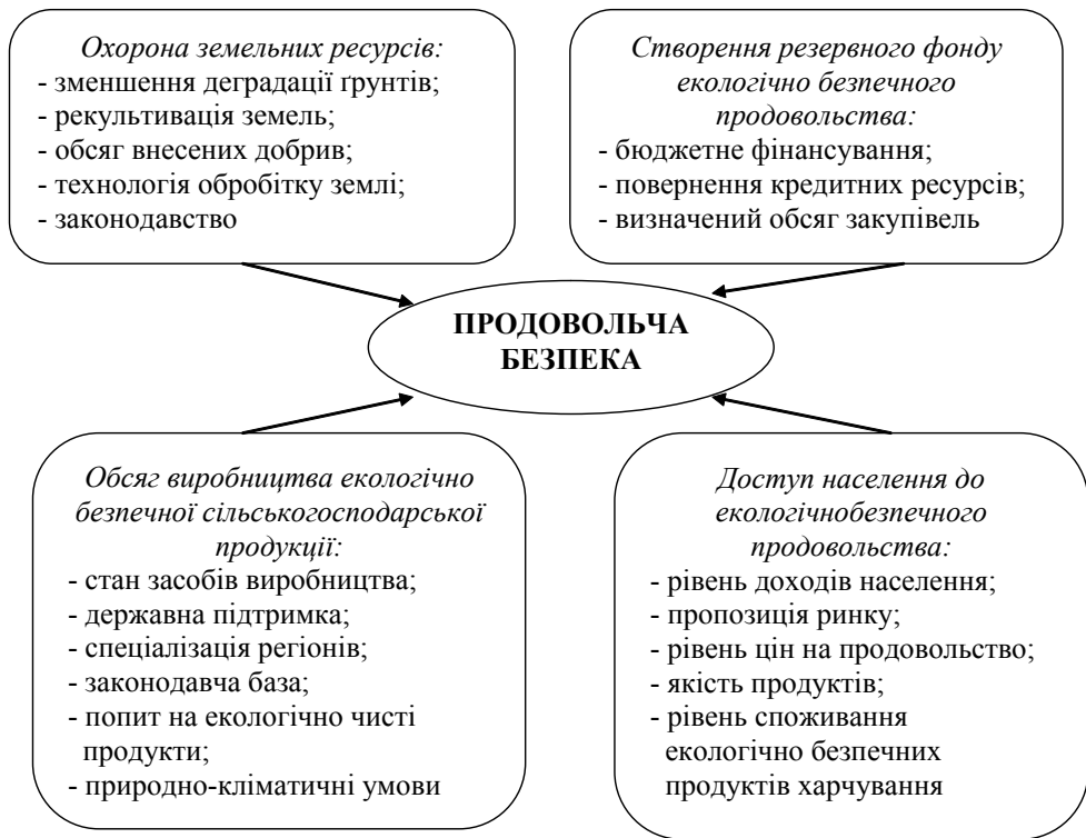
Рис. 1. Основні фактори, що забезпечують рівень продовольчої безпеки