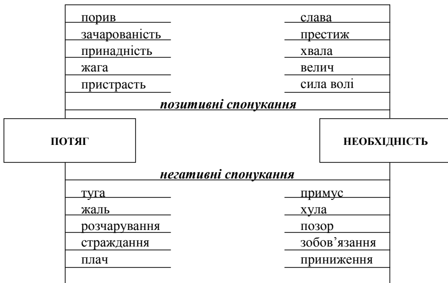
Рис. 3. Двомодальна структура спонукань

Якщо вказані архетипи та їхні характеристики вибудувати за двомодальною структурою, то стануть зрозумілими можливі напрями впливу на психоемоційну архітектуру та психокультурні характеристики (рис. 3).