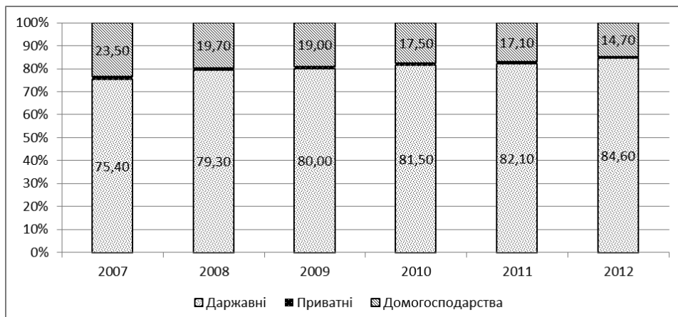
Рис. 1. Розподіл загальних витрат на освіту (МСКО 0-6)

між якістю людського капіталу та економічними результатами в інформаційно-му суспільстві, український бізнес ігнорує замовлення освітніх послуг у вітчизняних провайдерів, що вказує на низьку конкурентоздатність вітчизняних ВНЗ.