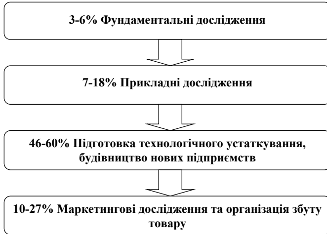
Рис. 1. Структура витрат на розробку і впровадження інновацій

Розподіл цих витрат у зарубіжних компаніях подано на рис. 1.