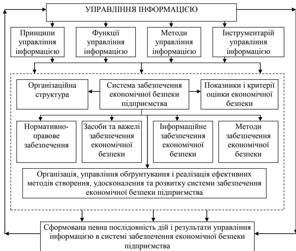
Рис. 1. Схема процесу управління інформацією в системі забезпечення економічної безпеки підприємства