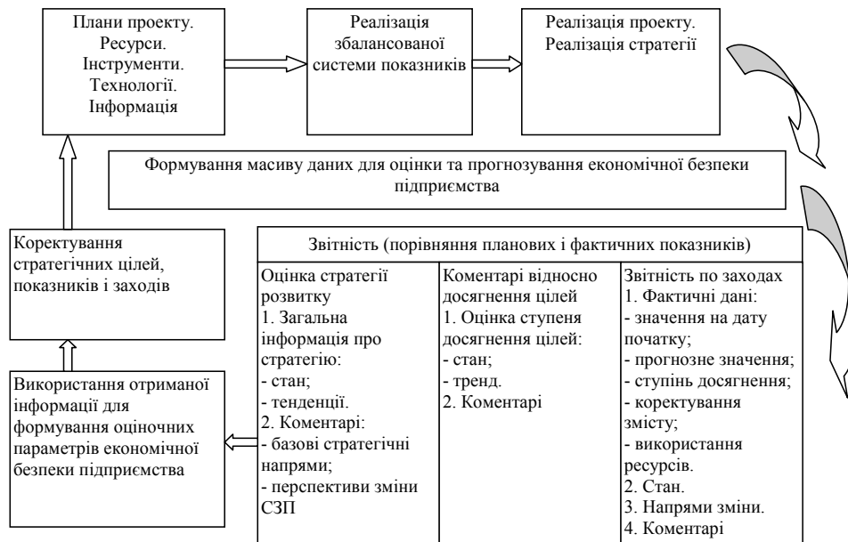
Рис. 3. Модель використання інформації при оцінці та прогнозуванні економічної безпеки підприємства з використанням елементів збалансованої системи показників

процедур і механізмів обробки інформації та отримання фактичних значень по показниках економічної безпеки для цілей проведення планфактного контролю і в розробленні процесів коректування стратегічних цілей і показників (рис. 3).