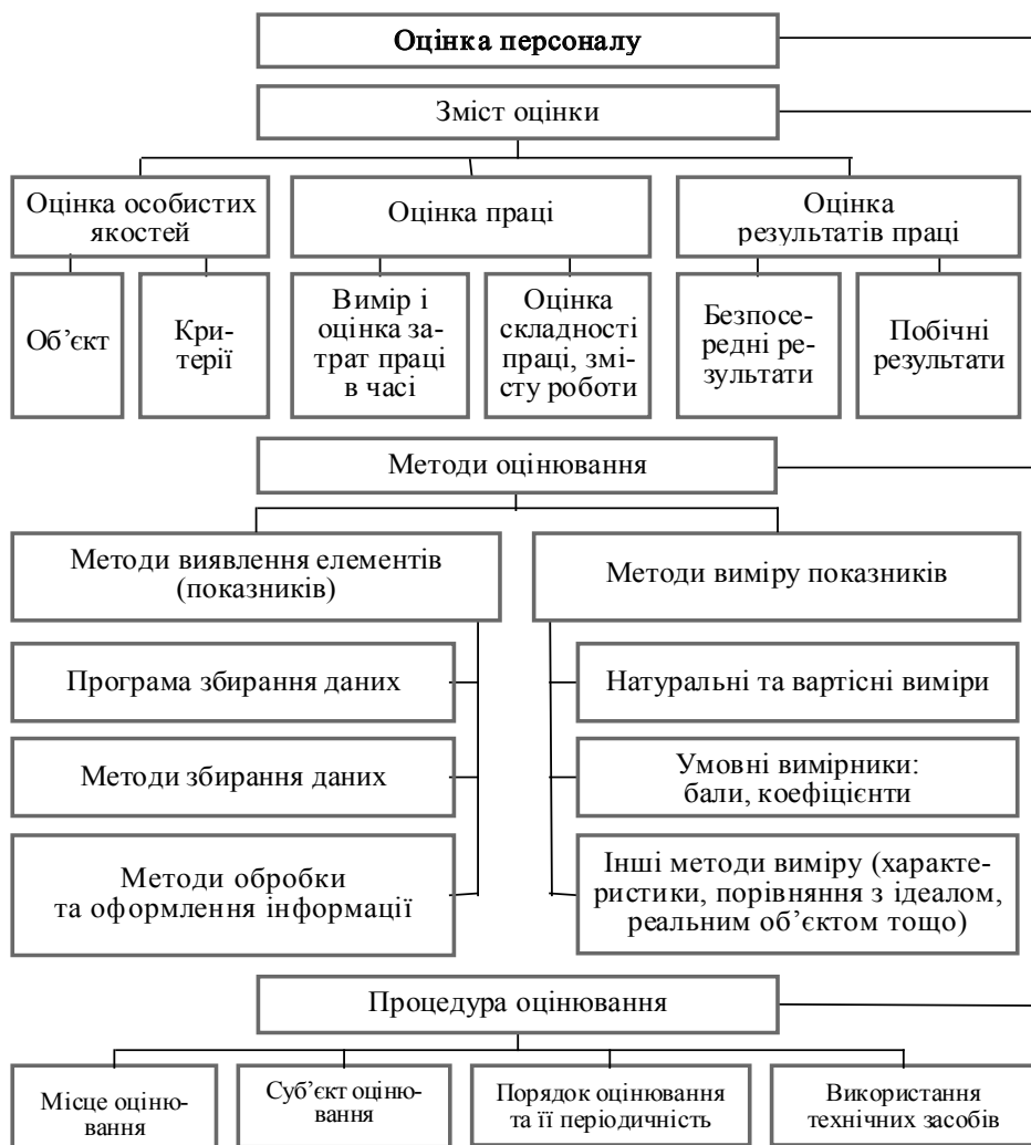
Рис. 2. Складові оцінки персоналу

Методи оцінювання персоналу повинні відповідати структурі випробуваль-