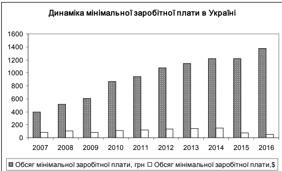
Рис. 2. Динаміка мінімальної заробітної плати в Україні

Наведені дані засвідчують закономірний зв'язок між середньою заробітною платою та обсягом виробництва на душу населення в країні. З усіх європейських