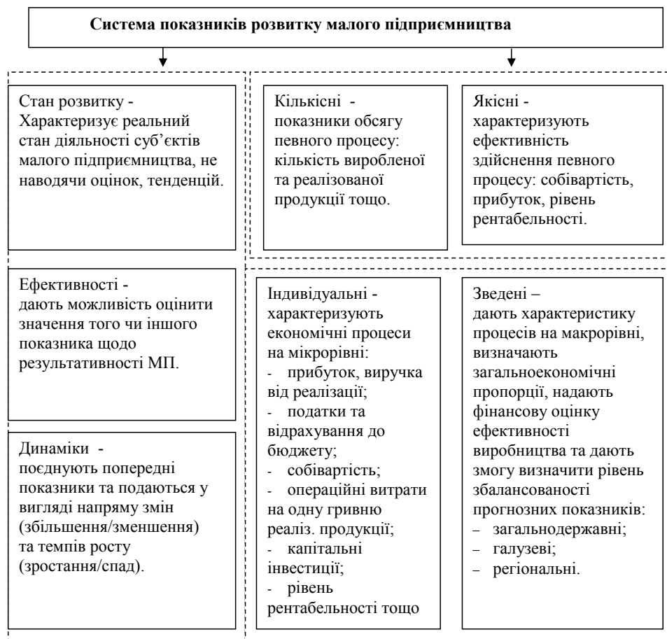
Рис. 2. Підходи до класифікації показників розвитку малого підприємництва