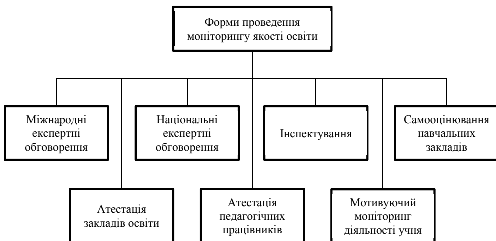
Рис. 1. Форми проведення моніторингу якості освіти

Основні форми проведення моніторингу якості освіти представлено на рис. 1. Базовими функціями інституції, що здійснює моніторинг якості освіти є: збирання даних; збереження даних; аналіз даних; утримання інформаційної системи управління освітою.