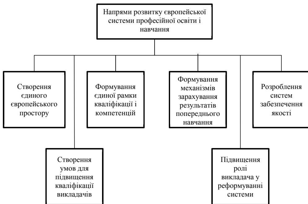
Рис. 2. Напрями розвитку європейської системи професійної освіти і навчання