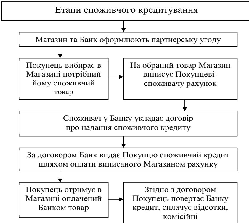
Рис. 1. Етапи споживчого кредитування

Схему класичного споживчого кредитування розглянемо на рис. 1.