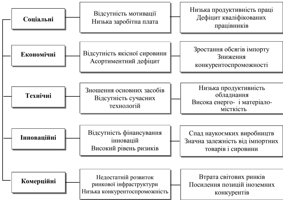
Рис. 2. Причинно-наслідкові ознаки інноваційного розвитку підприємств легкої промисловості