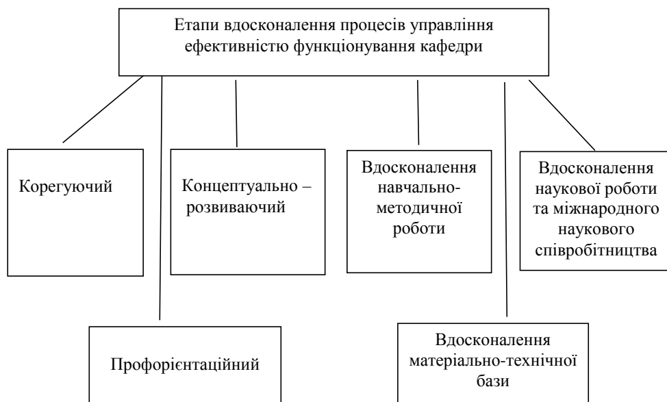
Рис. 2. Етапи вдосконалення процесів управління ефективністю функціонування кафедри