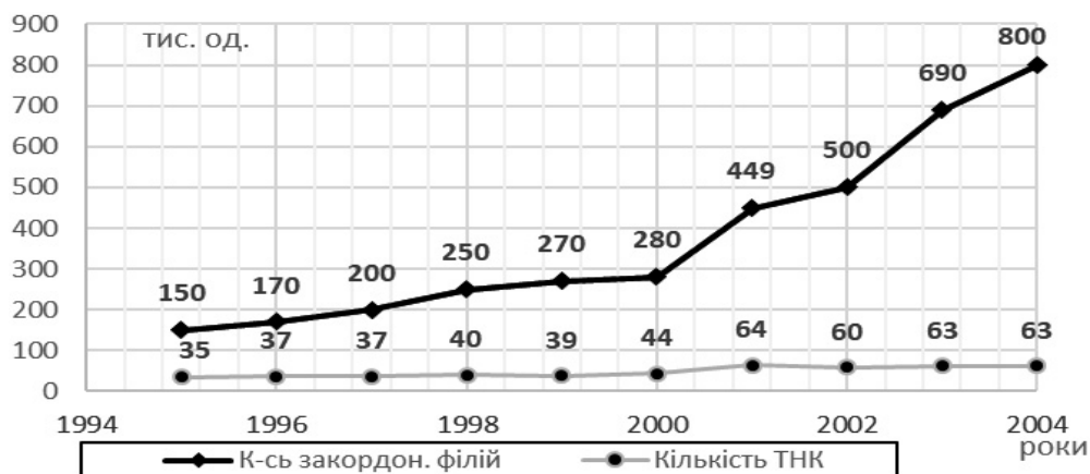
Рис. 1. Динаміка кількості ТНК