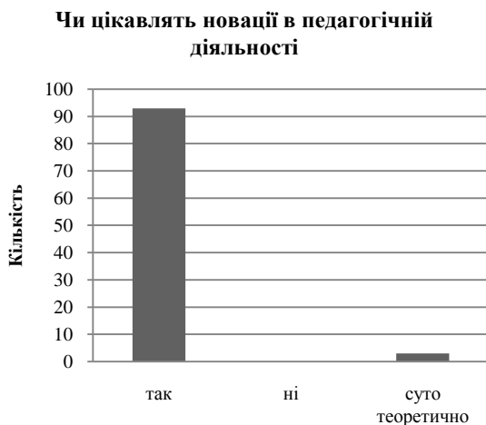
Рис. 1 Виявлення цікавості до інноваційних змін у педагогічній діяльності

упровадження нових педагогічних ідей. Було виявлено, що більшість опитуваних, а саме 75 викладачів із 96, вважають причиною цього недостатнє матеріальне забезпечення, 42 з 96 - психологічну неготовність учнів до сприйняття інновацій та 42 з 96 - консерватизм в освіті (рис. 2). Цікаво те, що «погане володіння комп'ютером» та «недостатнє знання психології дитини» обрало досить мало педагогів, а саме : 12 та 9 відповідно.