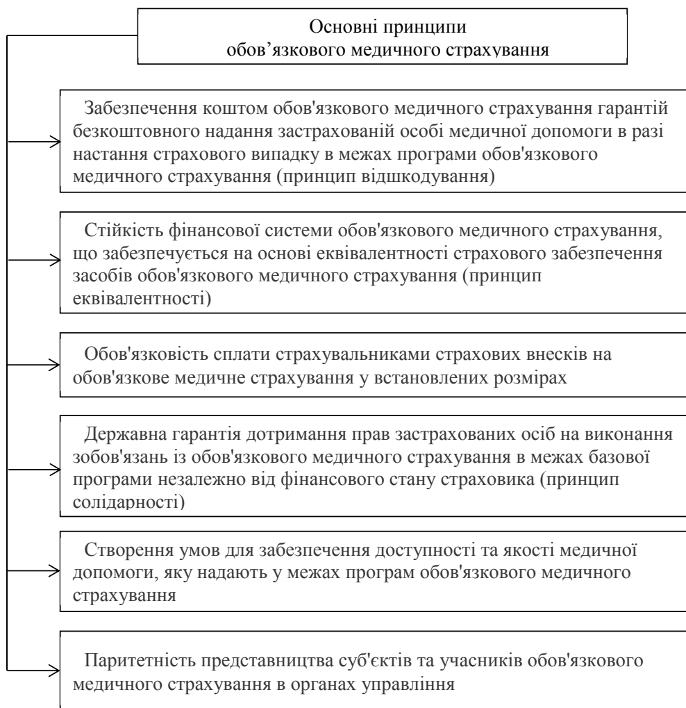
Рис. 1. Основні принципи обов'язкового медичного страхування