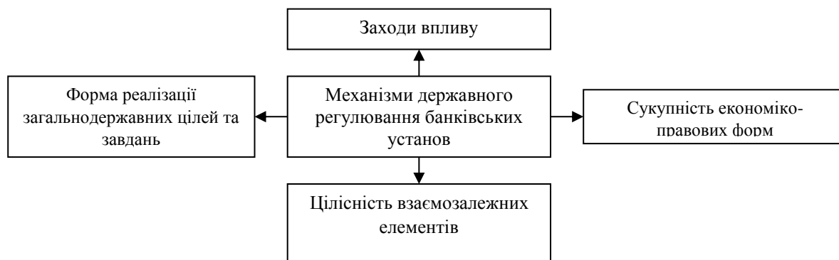
Рис. 1 Основні сучасні підходи до трактування поняття «механізми державного регулювання банківських установ»

для впливу на банківський сектор з метою забезпечення виконання поставлених загальнодержавних цілей та завдань.