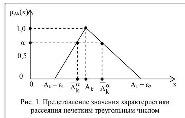
Рис. 1. Представление значения характеристики рассеяния нечетким треугольным числом

Схема экспертиз предусматривает, что каждый \ell -й эксперт выражает свое субъективное мнение в виде трех значений о A_k -ой характеристике рассеяния объекта ДЗЗ, а именно: (A_k^\ell + \varepsilon_1^\ell) – негативную оценку (возрастающий участок треугольника); A_k^\ell – оценку, наиболее ожидаемую (вершина треугольника); (A_k^\ell + \varepsilon_2^\ell) – позитивную оценку (спадающий участок треугольника). Потом эти оценки соответственно усредняются с учетом взвешивающих коэффициентов экспертов и получают описание A_k -й характеристики рассеяния объекта ДЗЗ.