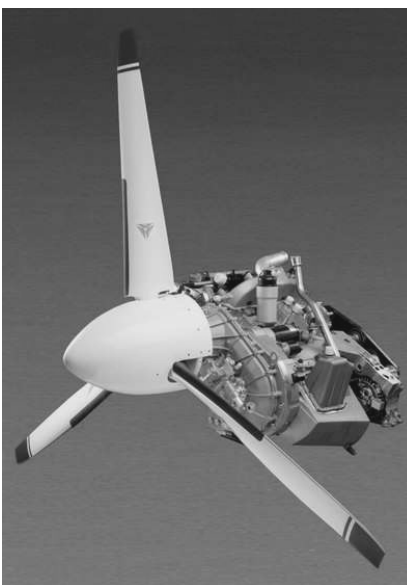
Рис. 1. Дизельный двигатель поршневого самолета

Одним из наиболее значительных новшеств в европейской автомобильной промышленности в последние годы была разработка дизельных двигателей с прямым впрыском, и турбонаддувом (TDi). В Европе дизельные установки причисляются к большому бизнесу, в основном из-за налогов на топливо, которые примерно в два раза выше, чем в США. Дизельные моторы, разработанные такими гигантами, как BMW, Mercedes и Volkswagen,